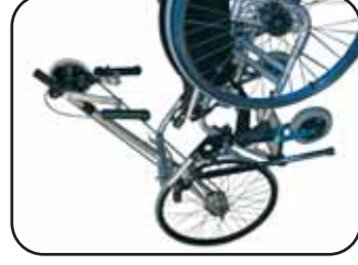
Applicazione dell' Easybike ad una carrozzina