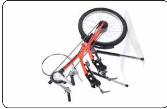
EASYBIKE 8F KID