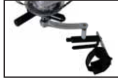
Manopola di spinta per tetraplegici