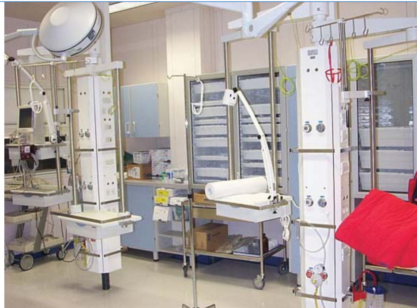
Zona primo intervento Zona primo intervento Zona primo intervento