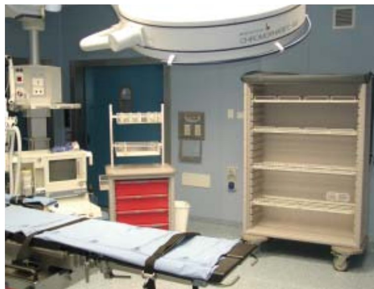
Carrelli e contenitori mobili Carrelli e contenitori mobili Carrelli e contenitori mobili