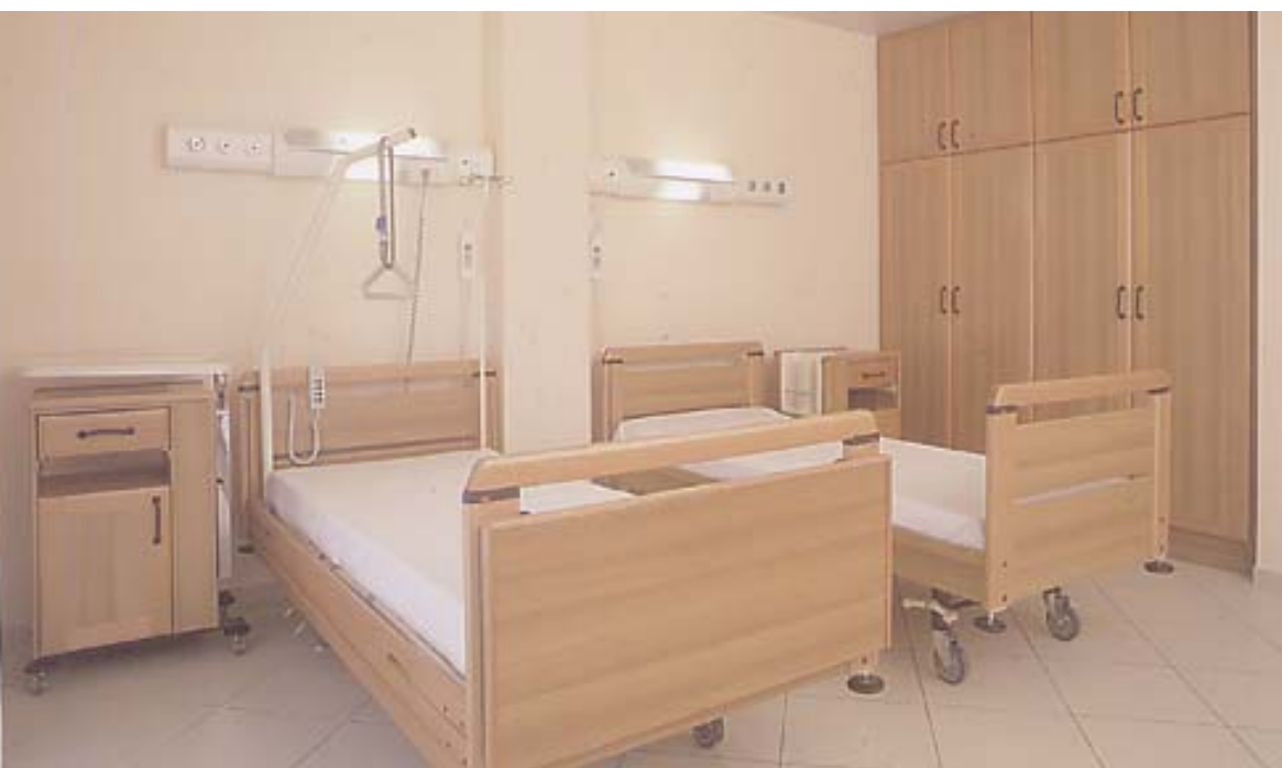
Stanza degenza Stanza degenza Stanza degenza