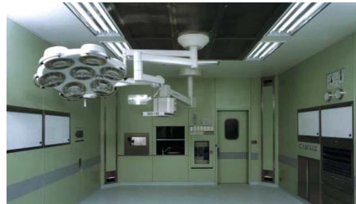
Arcispedale "S. Maria Nuova" Reggio Emilia