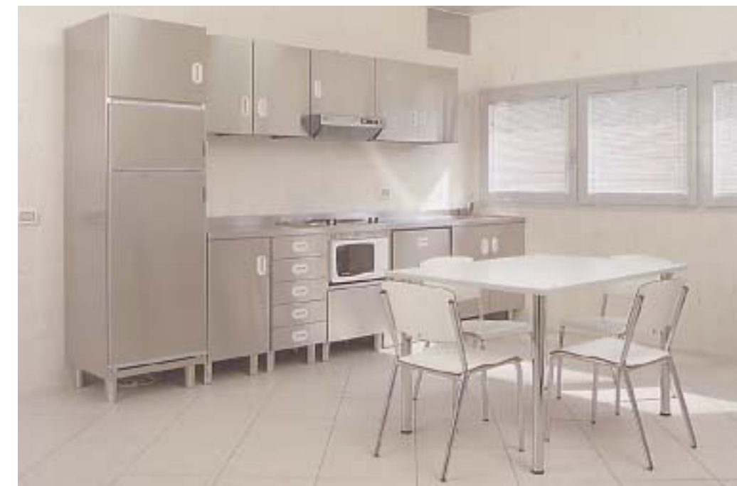
Cucinette di reparto Cucinette di reparto Cucinette di reparto