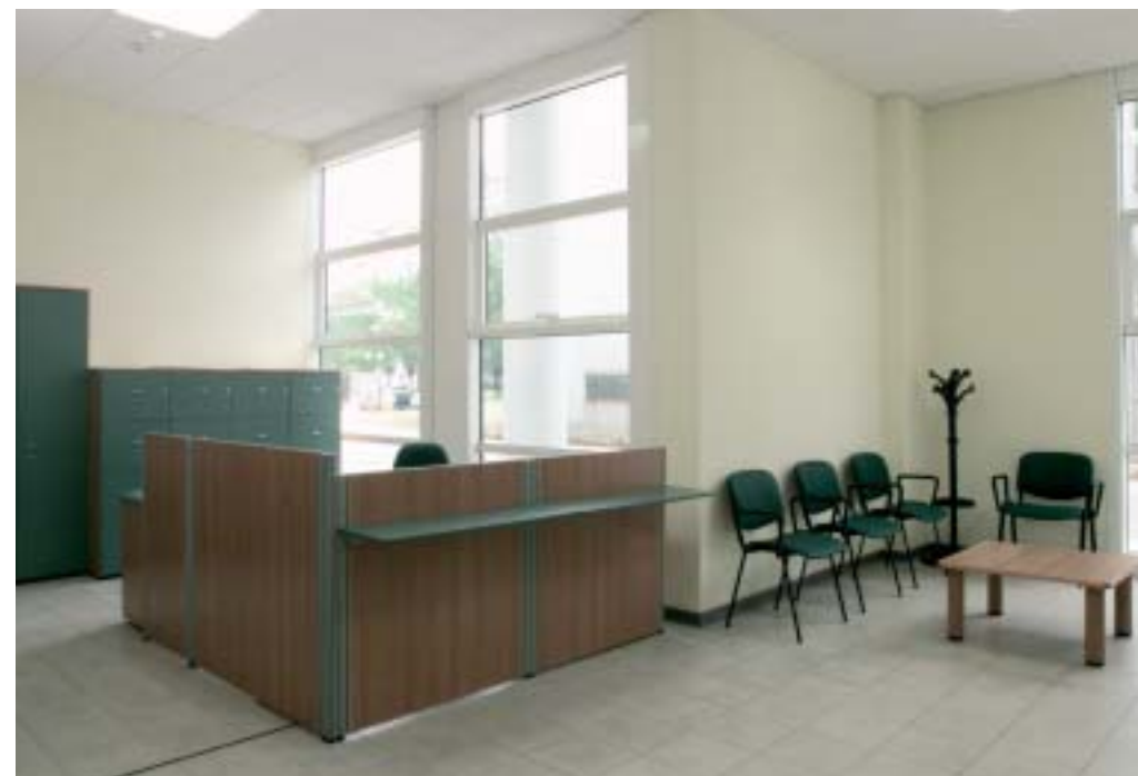
Sala d'attesa Sala d'attesa Sala d'attesa