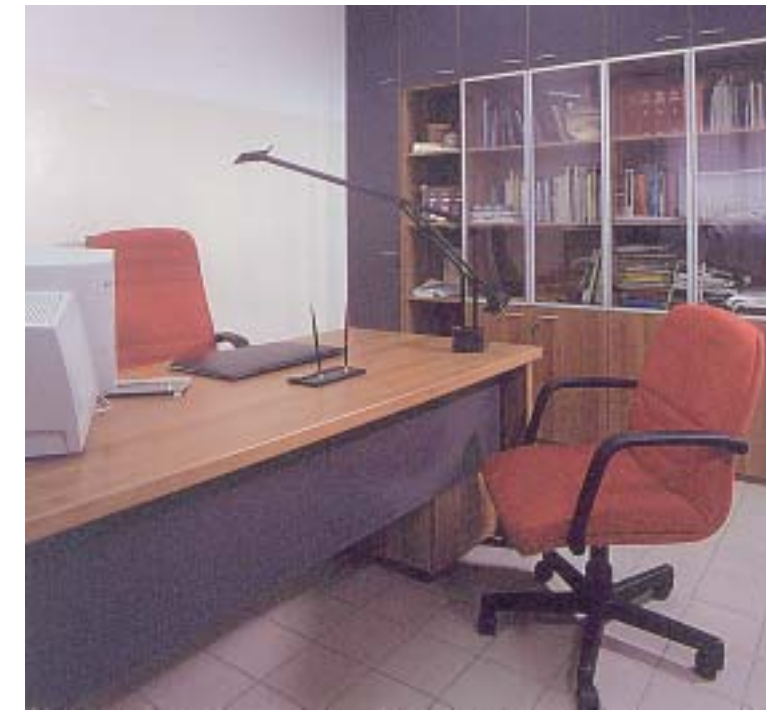
Uffici Uffici Uffici