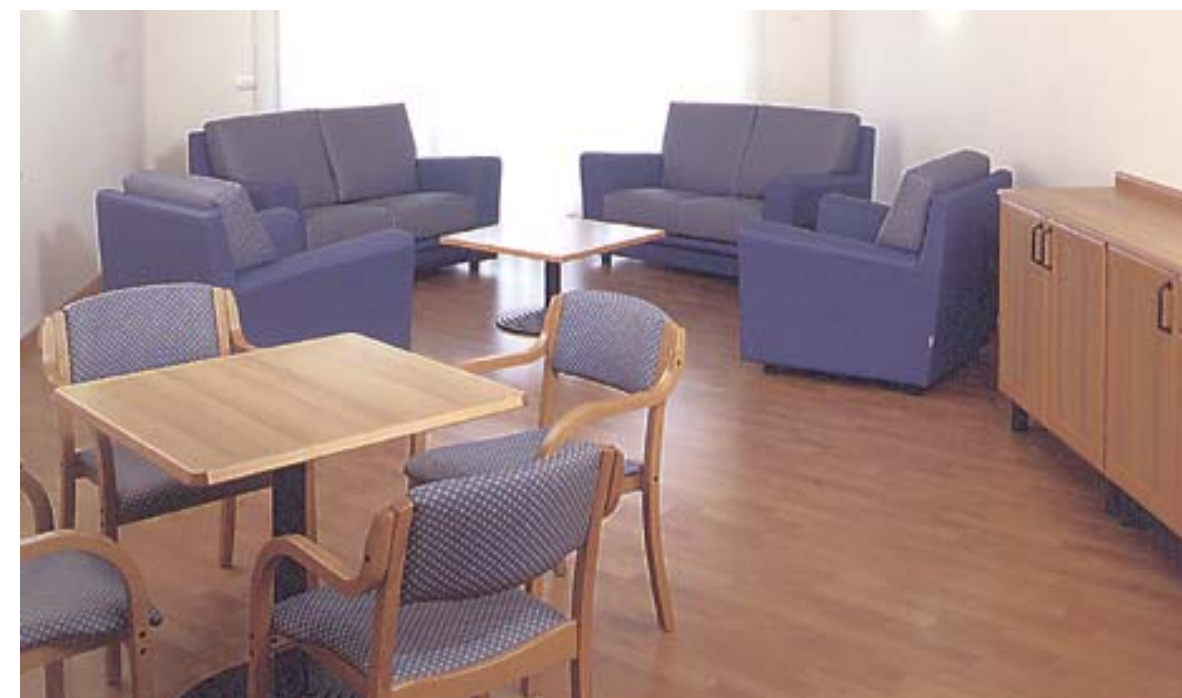
Salottino Salottino Salottino