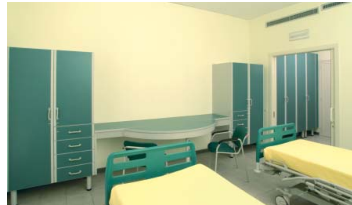
Armadiature su misura Armadiature su misura Armadiature su misura