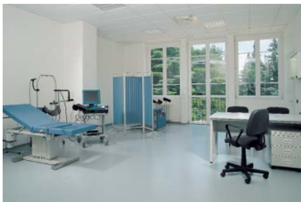
Ambulatorio Ambulatorio Ambulatorio