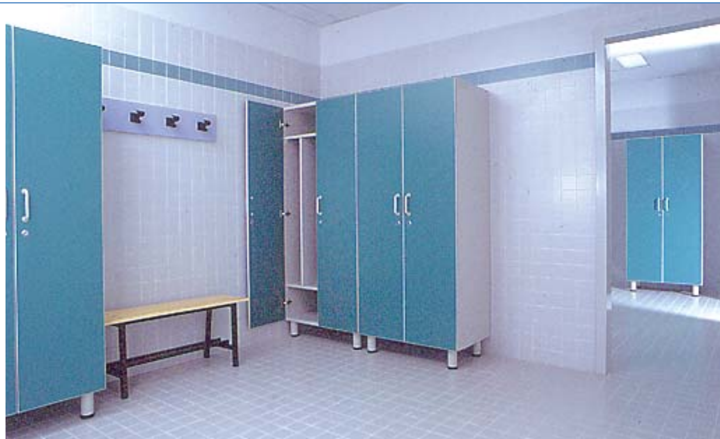
Spogliatoi Spogliatoi Spogliatoi