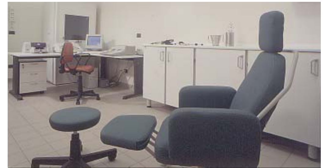
Ambulatorio specialistico Ambulatorio specialistico Ambulatorio specialistico