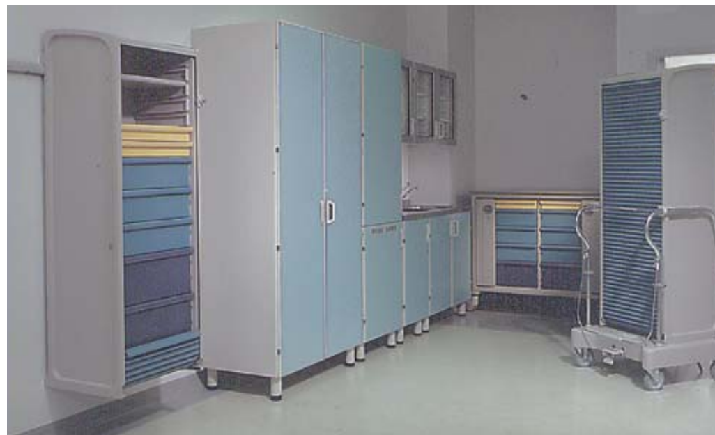
Contenitori attrezzati Contenitori attrezzati Contenitori attrezzati