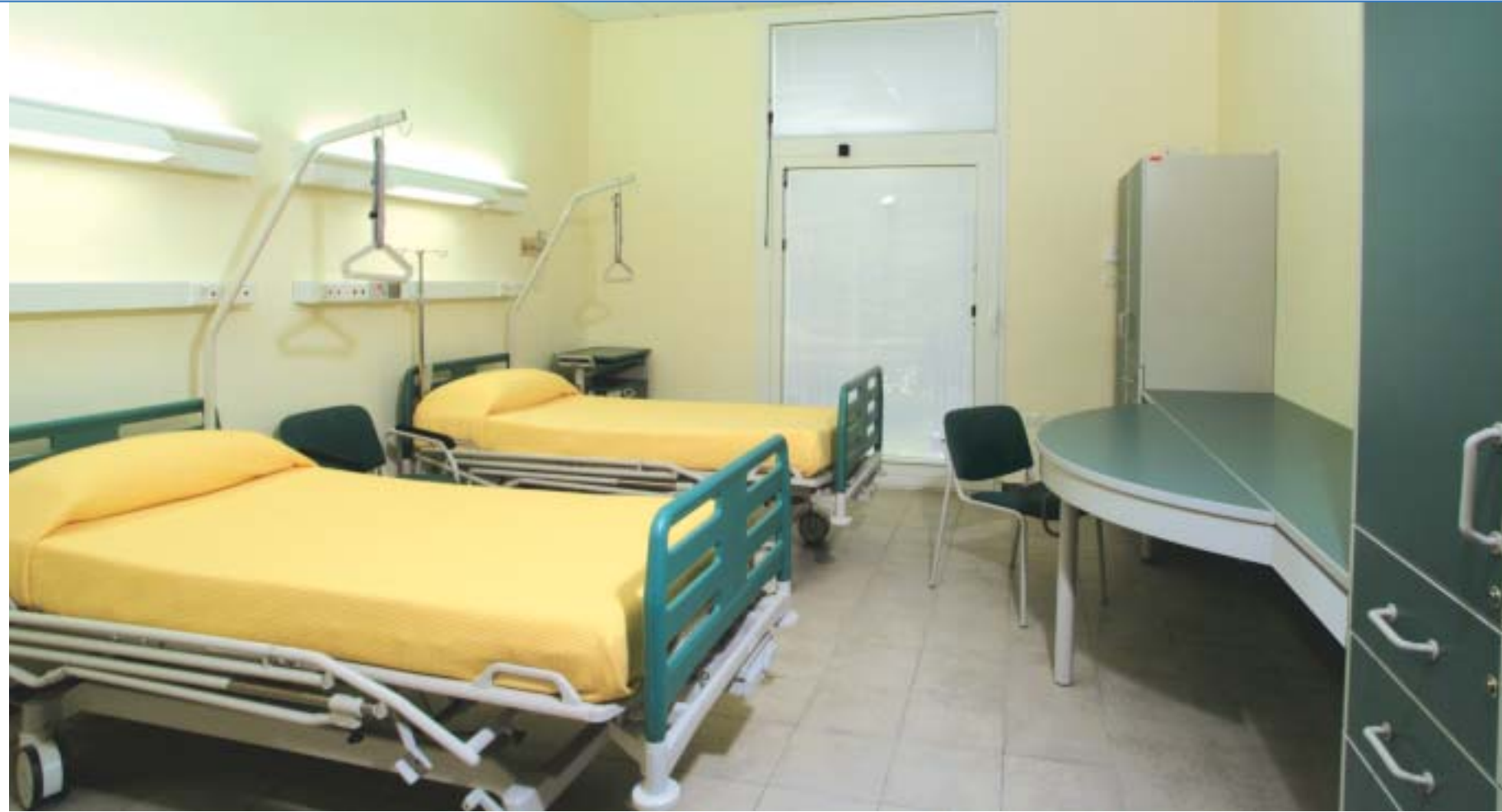
Camera 2 posti letto Camera 2 posti letto Camera 2 posti letto