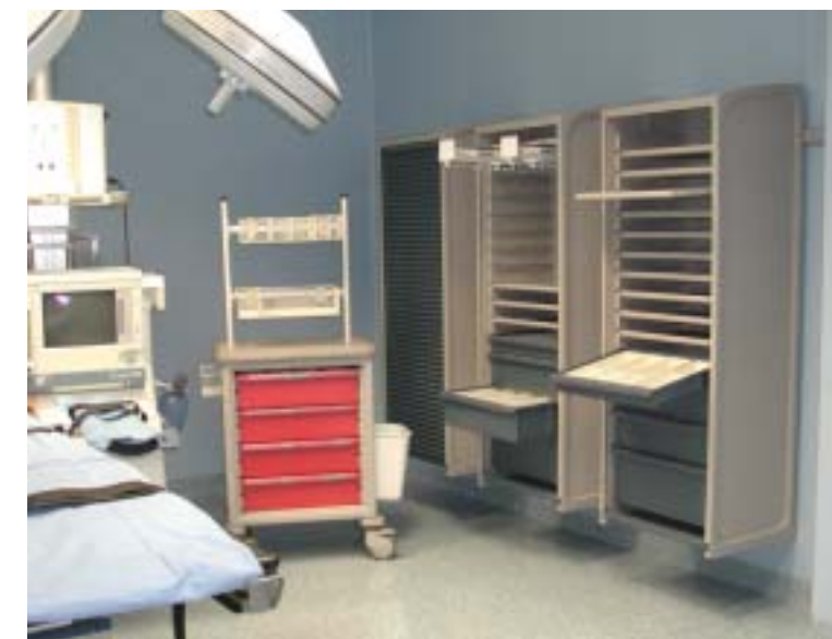
Carrelli e contenitori mobili Carrelli e contenitori mobili Carrelli e contenitori mobili