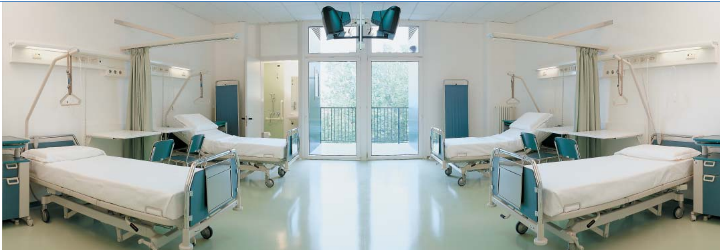
Stanza degenza Stanza degenza Stanza degenza

Montecatone Rehabilitation Institute - Imola