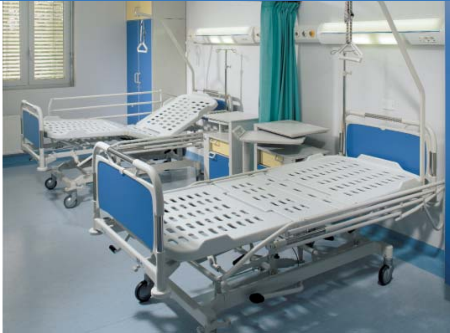
Camera 2 posti Camera 2 posti Camera 2 posti