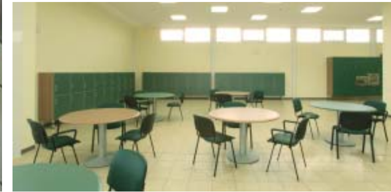
Caffetteria zone ingresso e relax Caffetteria zone ingresso e relax Caffetteria zone ingresso e relax