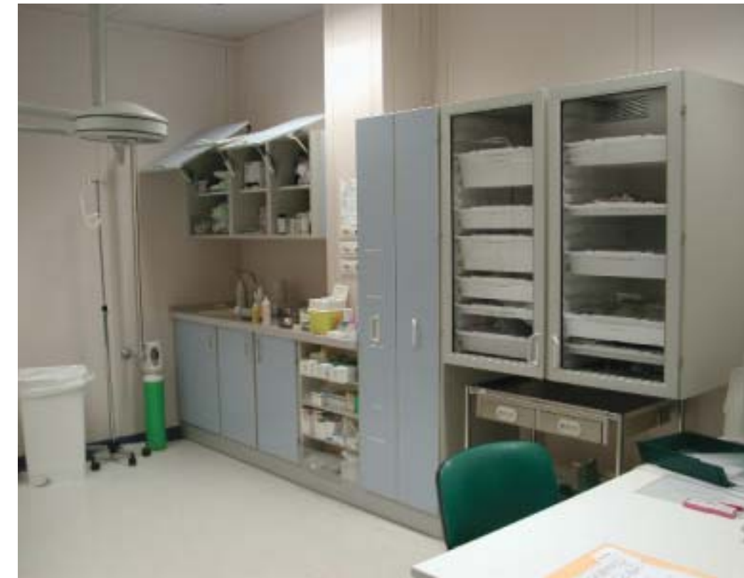
Ambulatorio specialistico Ambulatorio specialistico Ambulatorio specialistico