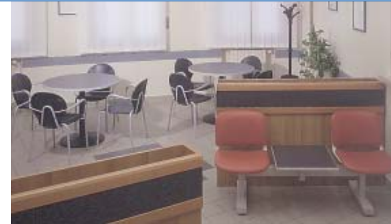
Sala d'attesa Sala d'attesa Sala d'attesa