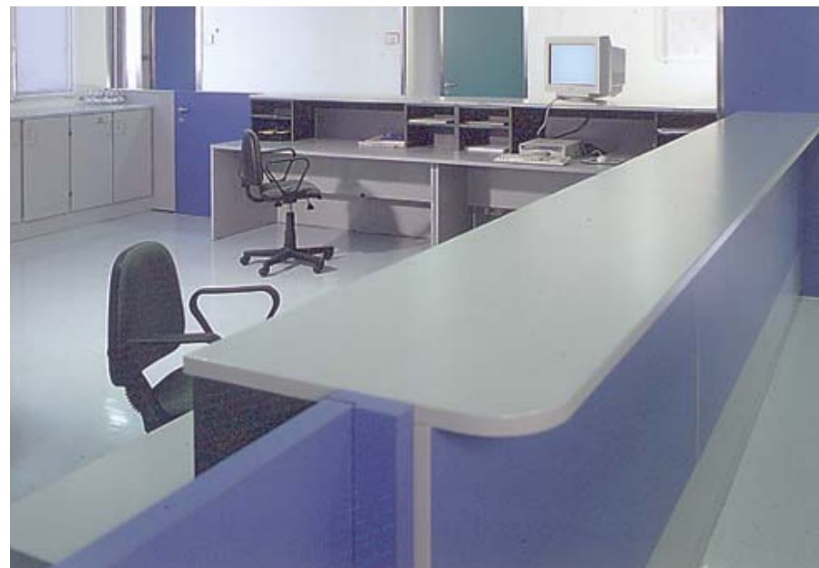
Open space reception lavoro infermieri