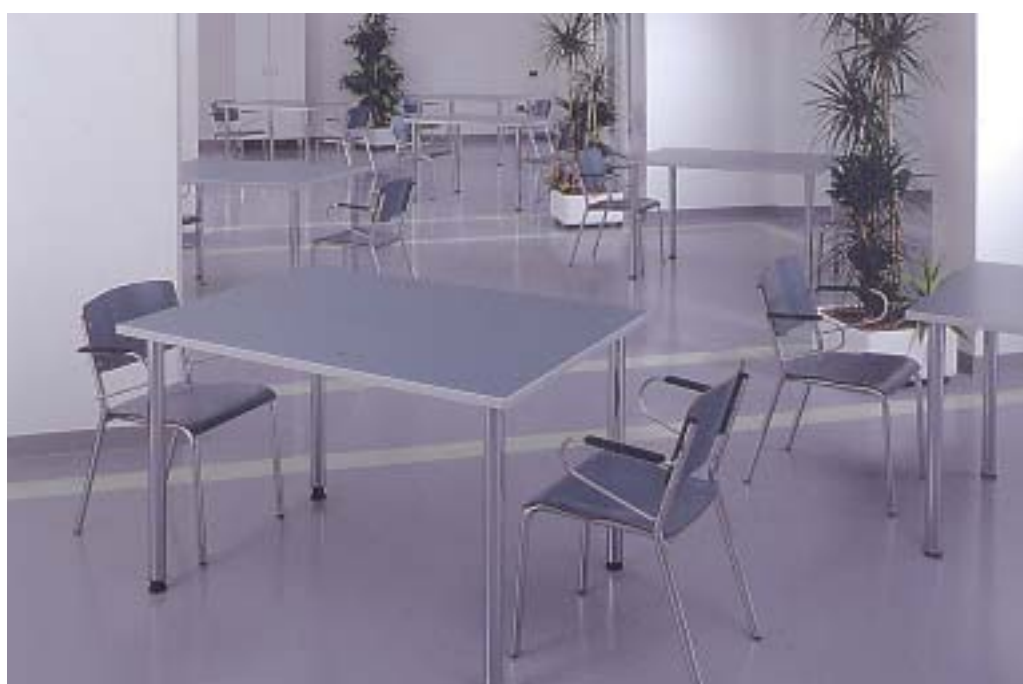
Soggiorno Soggiorno Soggiorno