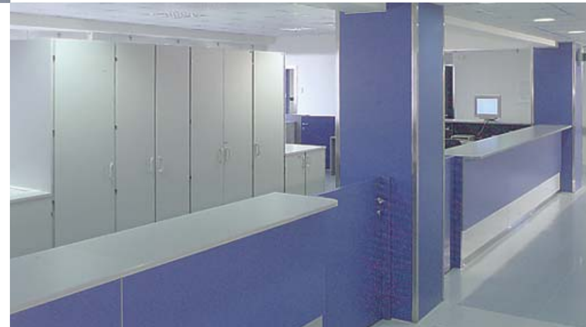
Particolare zona Open space