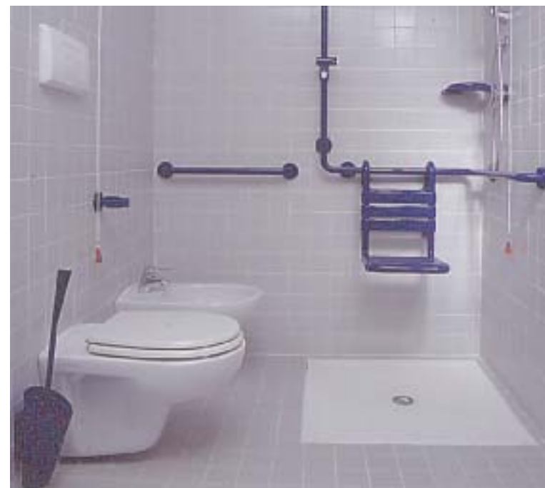
Accessori bagno Accessori bagno Accessori bagno