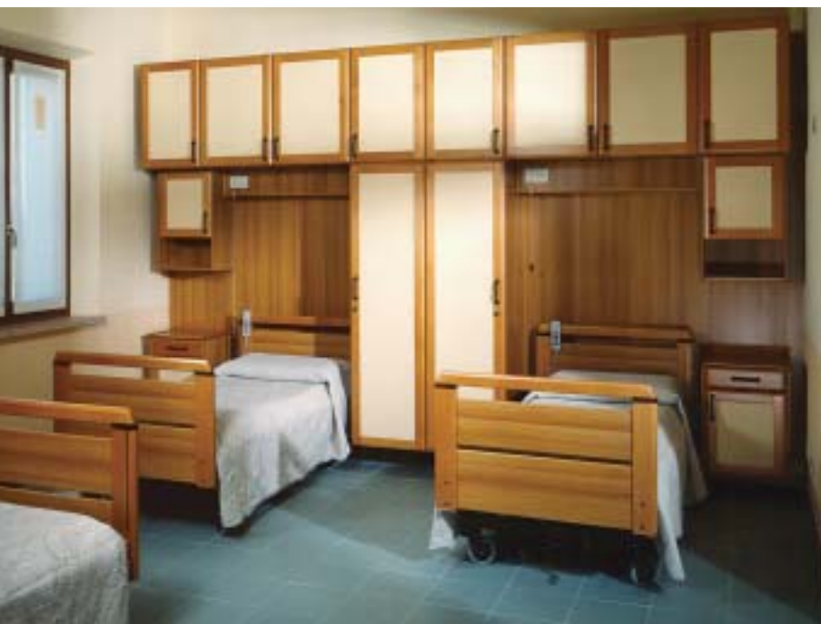
Istituto "Ottavio Trento" Casa Cavalli - Vicenza

Spécialisée dans le projet et la construction de parois, portes automatiques et composants complémentaires pour salles d'opération et de thérapie intensive. Plus de 200 salles déjà réalisées au cours des dernières années attestent l'approbation croissante obtenue par la société sur le marché.