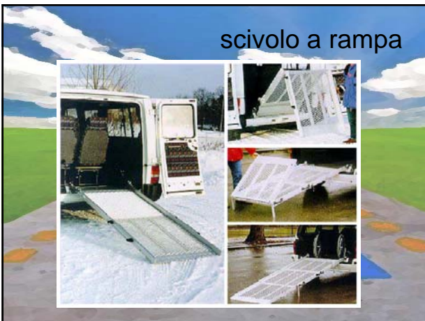
scivolo a rampa