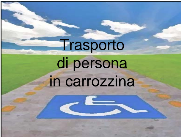
Trasporto di persona in carrozzina