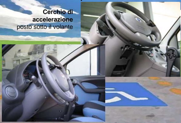
Cerchio di accelerazione posto sotto il volante