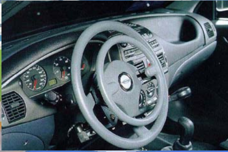
Cerchio di accelerazione meccanico