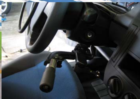
Freno a lungo braccio sotto il volante