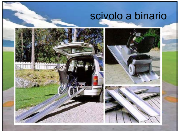
scivolo a binario