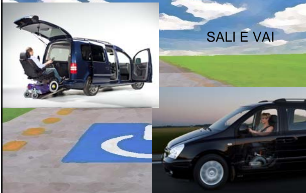
Guidare in carrozzina