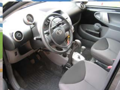
Cerchio di accelerazione posto sopra il volante