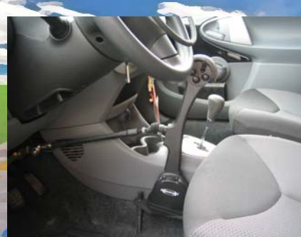
Freno a lungo braccio a pavimento