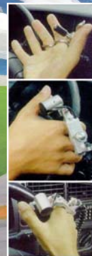
Acceleratore a leva