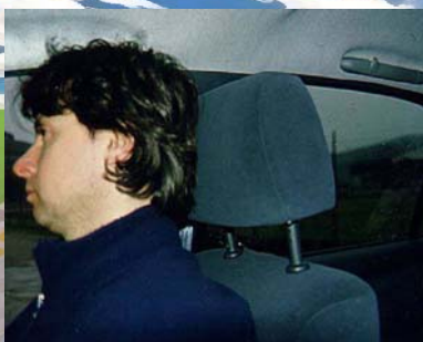
Comandi elettrici a pulsante Comando vocale