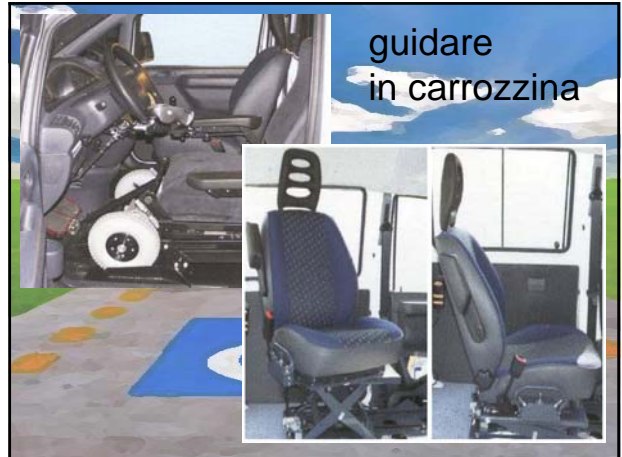
guidare in carrozzina