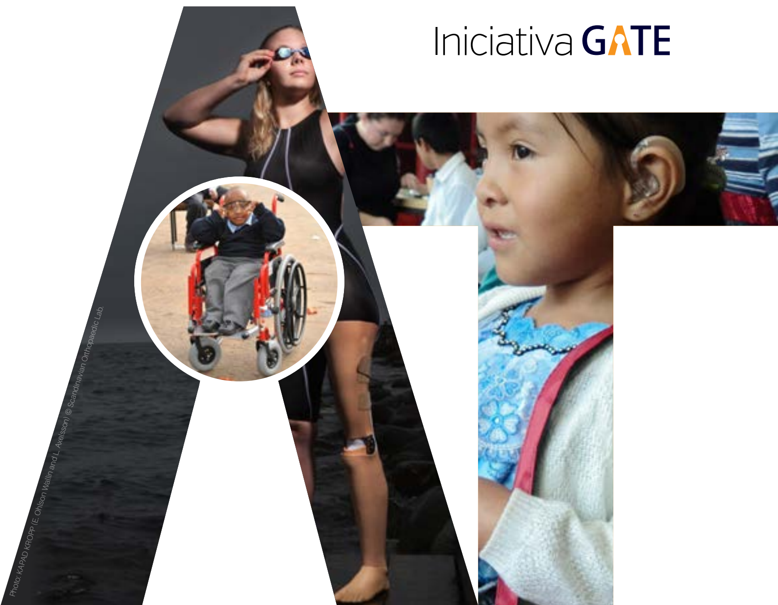
Photo: KAPAD KROPP (E. Ohlsson Wallin and L. Axelsson) © Scandinavian Orthopaedic Lab.