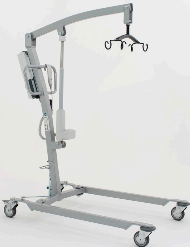
Invacare Atlante - versione elettrica