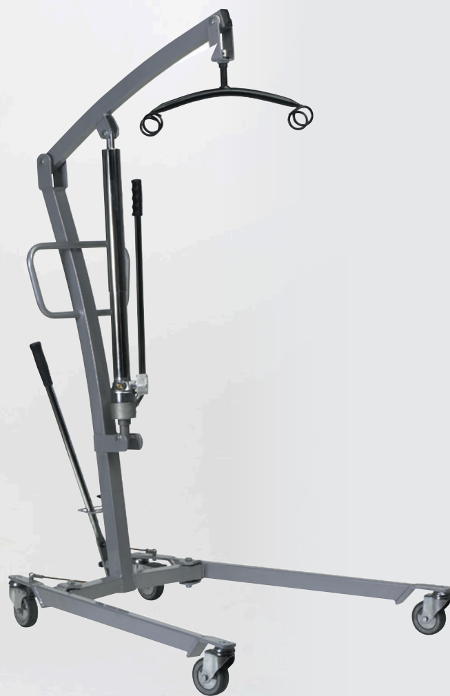
Invacare Atlante - versione manuale