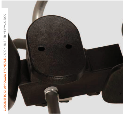
CUSCINETTO DI APOGGIO FRONTALE DISPONIBILE PER MEYWALK 2000