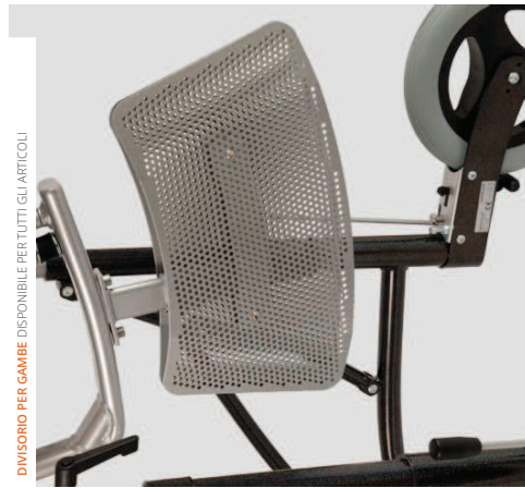
DIVISORIO PER GAMBE DISPONIBILE PER TUTTI GLI ARTICOLI