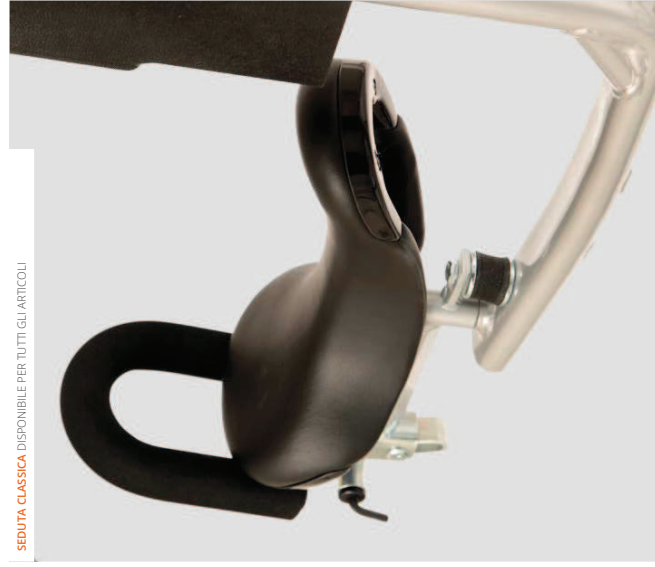
SEDUTA CLASSICA DISPONIBILE PER TUTTI GLI ARTICOLI