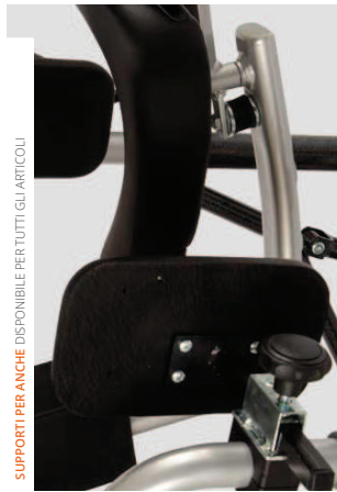
SUPPORTI PER ANCHE DISPONIBILE PER TUTTI GLI ARTICOLI