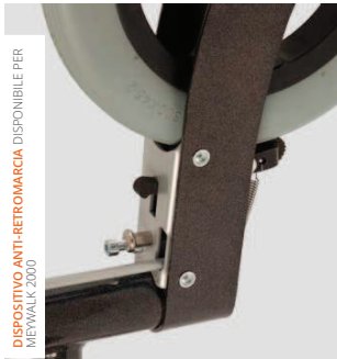
DISPOSITIVO ANTI-RETROMARCIA DISPONIBILE PER MEYWALK 2000