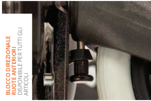
BLOCCO DIREZIONALE RUOTE ANTERIORI DISPONIBILE PER TUTTI GLI ARTICOLI