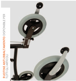
RUOTINE ANTI-RIBALTAMENTO DISPONIBILE PER TUTTI GLI ARTICOLI