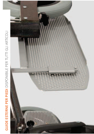
GUIDE ESTERNE PER PIEDI DISPONIBILE PER TUTTI GLI ARTICOLI