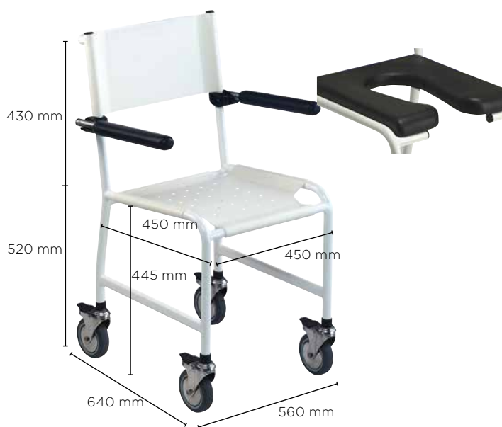
Invacare Revato R7710,073 / R7711,073

Struttura in acciaio rivestito in Rilsan e viteria inox ad alta resistenza contro la corrosione, ideale per l'utilizzo in collettività.