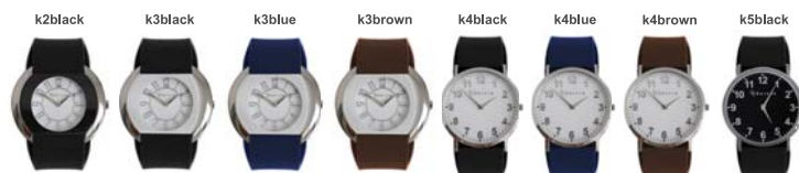
Differenti modelli di quadrante e di colori del cinturino che potrà scegliere