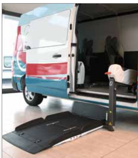
Sollevatore Fiorella Slim Fit F360 EX