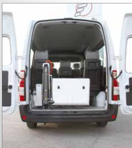
Sollevatore Fiorella Slim Fit F360