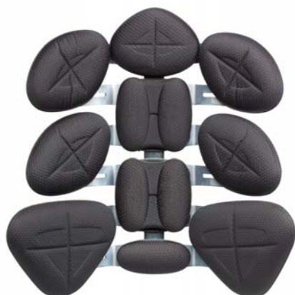
6 vertebre standard