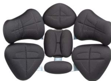
4 vertebre contour (avvolgente)