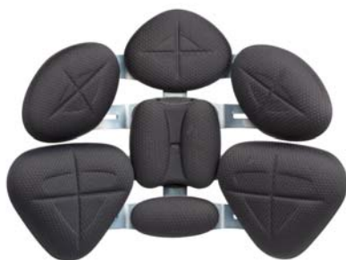
4 vertebre standard

L'idea iniziale è stata poi "standardizzata", grazie all'esperienza acquisita, nei sei modelli di schienale più richiesti. Questi modelli sono suddivisi in una versione con doghe standard e in quella a doghe "curve" cioè avvolgenti. Ciascuna delle due versioni è disponibile in quattro semplici misure: Small, Medium, Large, Extralarge.