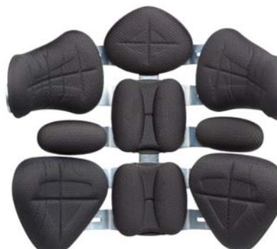
5 vertebre contour (avvolgente)