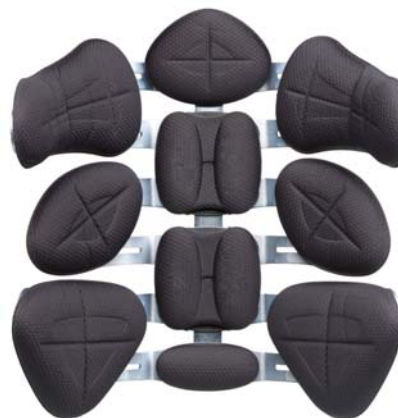
6 vertebre contour (avvolgente)