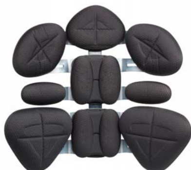
5 vertebre standard