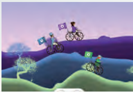
Escursione in montagna