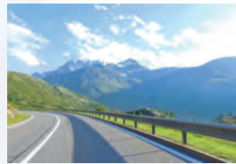
Escursione in campagna