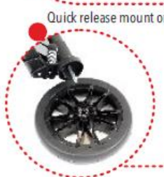
Quick release mount on all 4 wheels