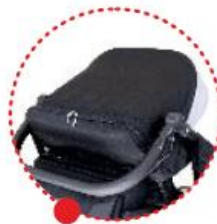
Canopy with window