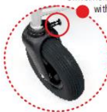
Swivel front castor wheels with option to lock